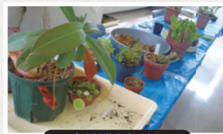
食虫植物を育てよう

★マークは対象学年を表し ★は小学校低学年 ★★は中学年 ★★★は高学年で参加制限ではありません