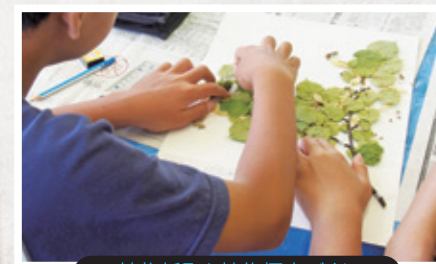
植物採取と植物標本づくり