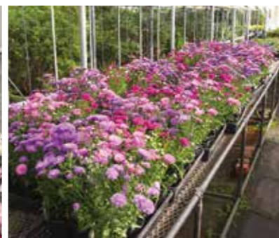
左:アザレア 上:出番待ちのクジャクアスター

9月以降に来園された方は、温室出入口に飾った華やかな花々にお気づきのことと思います。