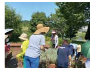
ハーブ教室の様子