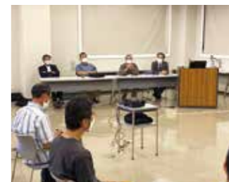
先生方との質疑応答