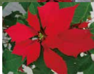
クリスマスの定番の植物 ポインセチアとシクラメン