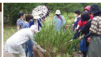
ハーブ園リニューアル作業