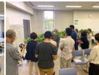
在来作物展示解説