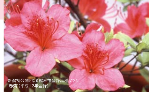
新潟初公開となる館林市登録品種ツツジ '春紫'(平成12年登録)