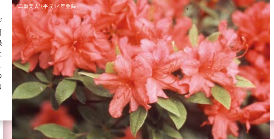
'二重美人'(平成14年登録)